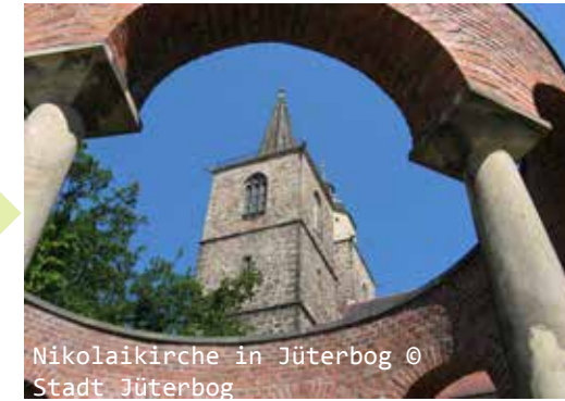
Nikolaikirche in Jüterbog @ Stadt Jüterbog

Anmeldung: bis Mittwoch, 11. November unter 030/ 422 42 76 oder direkt bei FRIEDA (bitte 65+Ticket angeben)